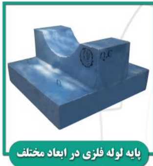
پایه لوله فلزی در ابعاد مختلف