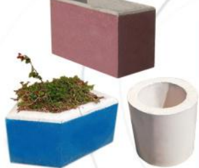
گلدان بتنی (جهت دار، استوانه، مستطیلی و...)