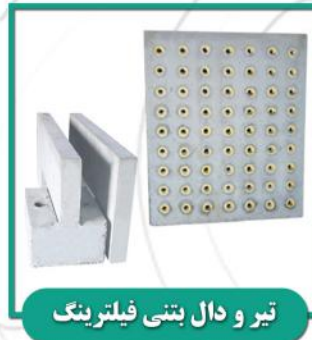
تیر و دال بتنی فیلترینگ