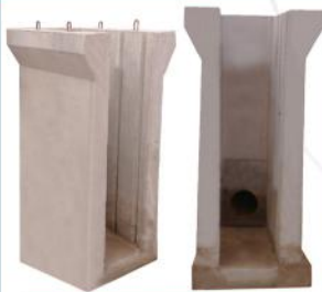
سازه خروجی حوضچه آب گیر (مانگ)