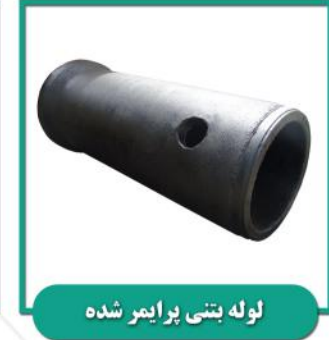
لوله بتنی پرایمر شده