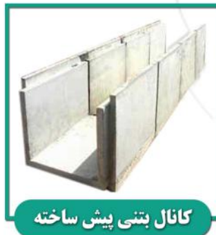
کانال بتنی پیش ساخته