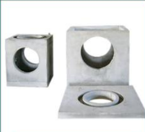
منهول مکعبی یک تکه و دو تکه