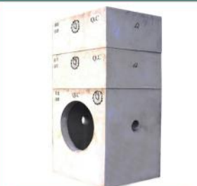
باکس های منهول با قابلیت افزایش ارتفاع