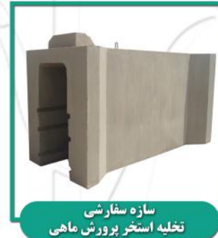
سازه سفارشی تخلیه استخر پرورش ماهی