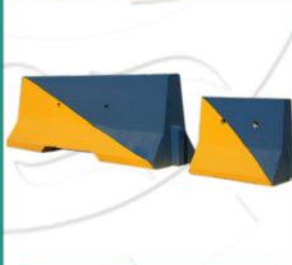
مانع خیابانی بتنی در ابعاد مختلف