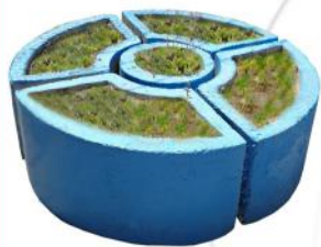
گلدان چند تکه