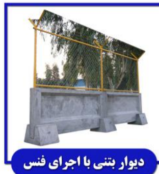
دیوار بتنی با اجرای فنس