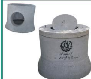
منهول لوله ای با درپوش دو تکه در ابعاد مختلف