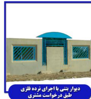
دیوار بتنی با اجرای نرده فلزی طبق درخواست مشتری