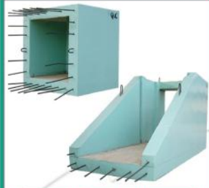
سازه های سفارشی (سازه یو شکل و باکس حوضچه)