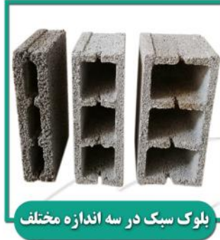
بلوک سبک در سه اندازه مختلف