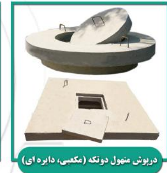
دربوش منبول دوتکه (مکعبی، دایره ای)