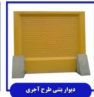
دیوار بتنی طرح آجری