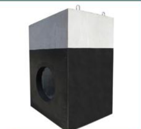
منهول در ابعاد مختلف