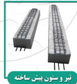
تیر و ستون پیش ساخته