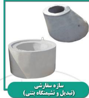
سازه سفارشی (تبدیل و نشیمنگاه بتنی)