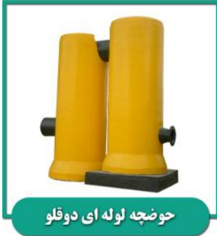
حوضچه لوله ای دوقلو