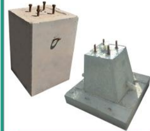
فوندانسیون تیر برق