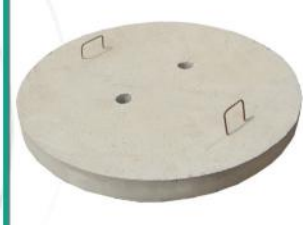
درپوش بتنی (فاضلاب و...)