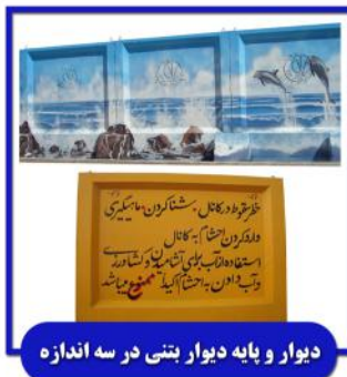
دیوار و پایه دیوار بتنی در سه اندازه