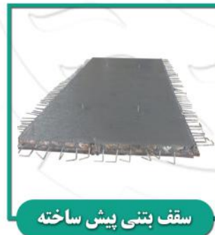
سقف بتنی پیش ساخته