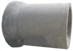
نیم لوله در ابعاد و مترای مختلف

تولیدکننده انواع سازه و لوله های بتنی و بتن آماده