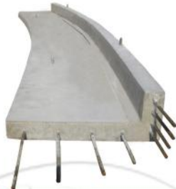
سکوهاى استادیوم فولاد خوزستان